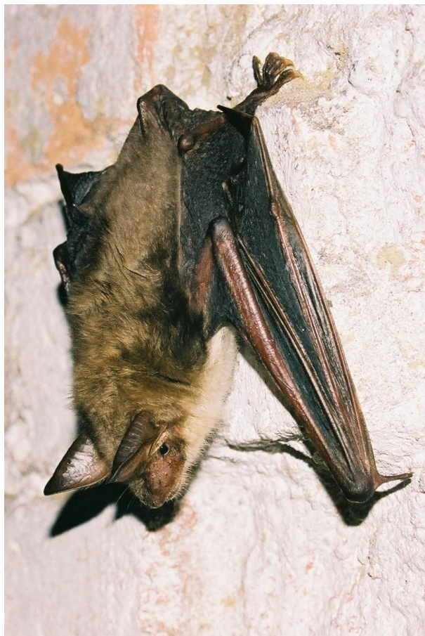
Nocek duży Myotis myotis .

Plany zadań ochronnych zostały opracowane w ramach realizacji projektu POIS.05.03.00-00-186/09 „Opracowanie planów zadań ochronnych dla obszarów Natura 2000 na obszarze Polski”, realizowanego w ramach działania 5.3. Opracowanie planów ochrony, priorytetu V Ochrona przyrody i kształtowanie postaw ekologicznych Programu Operacyjnego Infrastruktura i Środowisko 2007 - 2013.